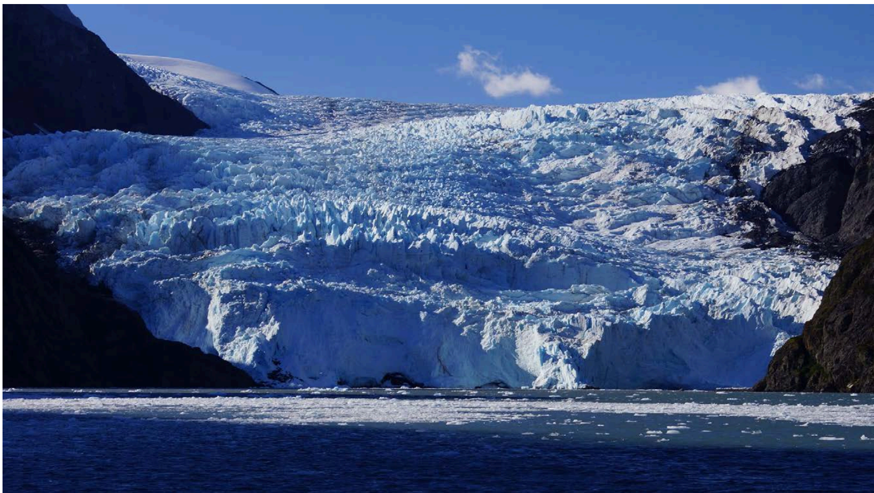
Az alaszakai gleccserek egyik óriása

Az északnyugati átjárói utunk 11 hét alatt 5000nmi volt nagyjából, a mostani pedig majdnem 3 hónapig tartott. Július 4-én indultunk és október 2-án értünk vissza. Ebből mondjuk 3 hetet le kell vonni, mert ennyi időt a szárazföldön töltöttünk. Ebben benne volt a hajó előkészítése és a végén a téliesítése is. Most egy kicsit többet mentünk mint tavaly, talán 5500nmi-t, tehát ez durván 10000km-nek felel meg, hiszen ez tengeri mérföld. Tehát elindultunk július 4-én. Nyolc átszállással jutottunk el Kanadába, ami 4-5 napig tartott a repülőgép késésekkel együtt. Majd megérkeztünk Tuktoyaktukba, ahol két hetet kellett töltenünk, mire egyáltalán hozzájuthattunk a hajóhoz. Itt nagyon drága volt a szállás, ezért inkább sátoroztunk.